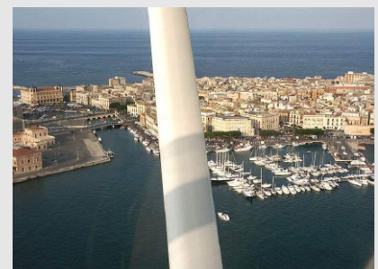
Marina Yachting di Siracusa

Treno: Da Catania, stop presso Stazione di Siracusa